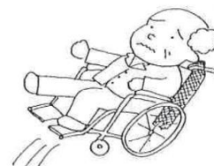
背もたれに体重かけ過ぎ注意!