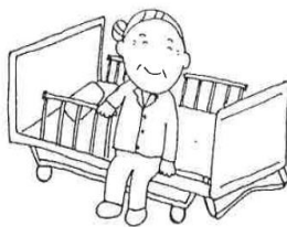
両足をしっかりと床につけて立ちましょう!