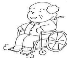
足台に足を乗せましょう!