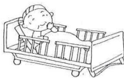
柵をあげましょう!