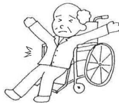
深く座りましょう!